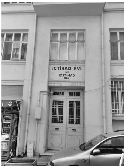
5. «Իչդիհադի տուն», Ֆաթիհ/Կոստանդնուպոլիս

Ջևդեթը հրատարակում է ամսագրի 358 համար մինչև 1932 թ. դեկտեմբեր: